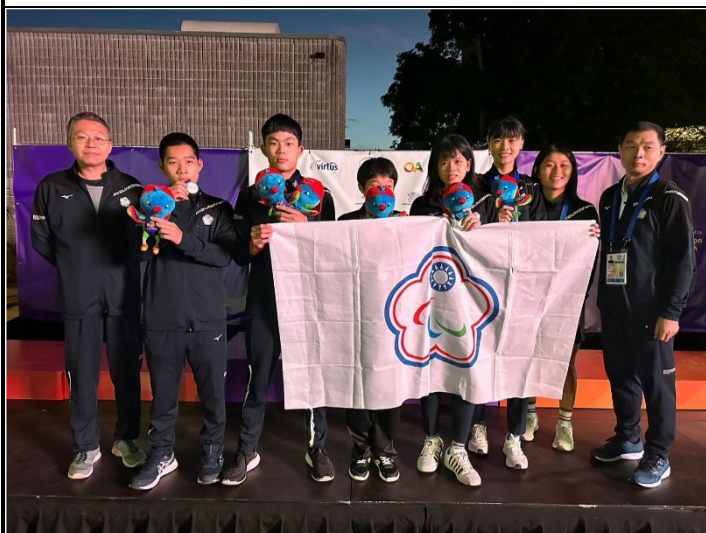
中華台北桌球代表隊合影